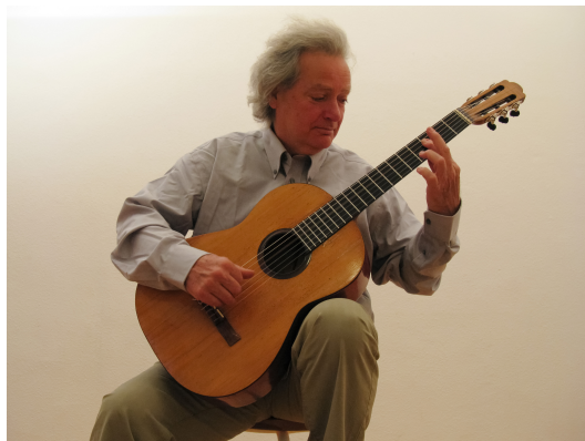
Carlo DOMENICONI, guitariste virtuose italien

Comme le montre la photographie ci-dessous, pour modifier la hauteur du son émis, le guitariste appuie sur la corde au niveau d'une case de façon à modifier la longueur de la corde utilisée. Des pièces métalliques, nommées frettes, délimitent les cases sur le manche de la guitare.