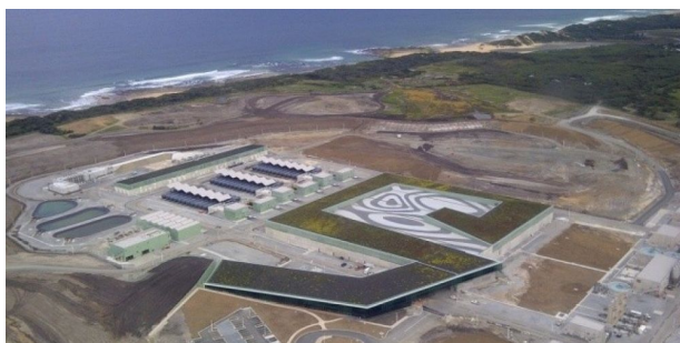
Usine de dessalement à Melbourne

Des effets notables sur sa vitalité ont été observés dès que la salinité atteint 37,4 g de sel par kilogramme d'eau de mer.